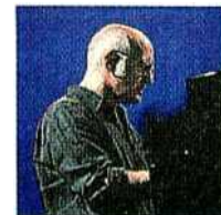
Compositore Ludovico Einaudi in concerto all'Auditorium

Ludovico Einaudi presenta stasera al Parco della Musica (ore 21, viale de Coubertin 30) il nuovo album «In A Time Lapse». «Quando diventi cosciente che il nostro tempo ha un limite, è il momento in cui cerchi di riempire quello spazio vuoto con tutta la tua energia e ricominci a vivere ogni istante della tua vita in modo pieno come quando eri bambino». Così Ludovico Einaudi presenta il suo nuovo album uscito il 22 gennaio, a tre anni di distanza da «Nightbook» (750 mila copie vendute). «In A Time Lapse» è stato composto in un anno ed è stato registrato nell'ottobre del 2012 nel monastero di Villa S. Fermo a Lonigo tra Verona e Vicenza. L'album è composto da quattordici brani, con una strumentazione che comprende pianoforte, archi, percussioni ed elettronica. Come nei precedenti lavori del compositore, si sviluppa come una suite, con un'idea che rimanda alla forma di un romanzo diviso in vari capitoli. Il lavoro esplora nuove tessiture sonore e arrangiamenti che fondono mondi musicali diversi.